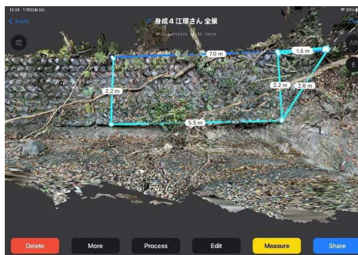
Illustration 3 : Vérification des valeurs sur la base des données