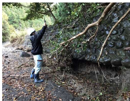
Illustration 1 : Réalisation de mesures 3D sur un site endommagé

Puisque nous n'en sommes qu'au début de l'utilisation des terminaux équipés d'un capteur LiDAR, il existe certaines difficultés. Nous espérons tout d'abord en améliorer la productivité en prenant pour objectif une gestion des infrastructures basée sur le système Virtual Shizuoka et les capteurs LiDAR des appareils mobiles, ainsi que par la formation du personnel qui exploite les données de nuages de points et la promotion de cette technologie.